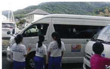
小・中学生夏休みボランティア体験事業