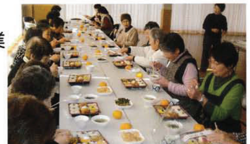
ふれあい・いきいきサロン事業