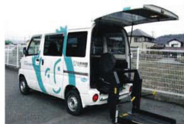
車いす車輛貸出事業