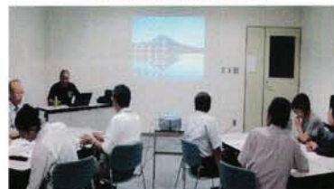
災害ボランティアセンター協力員養成事業