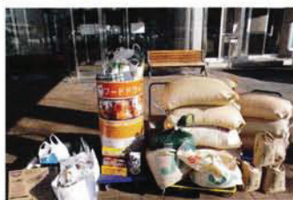
フードドライブ事業