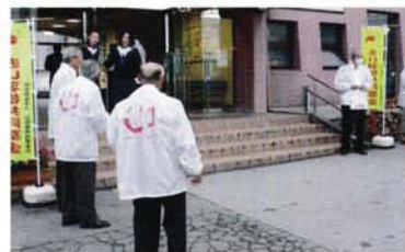
共同募金協力事業