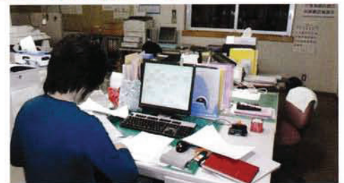
居宅介護支援事業