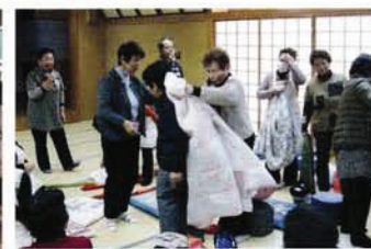
ボランティア連絡協議会事業