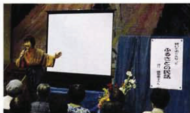
社会福祉大会事業