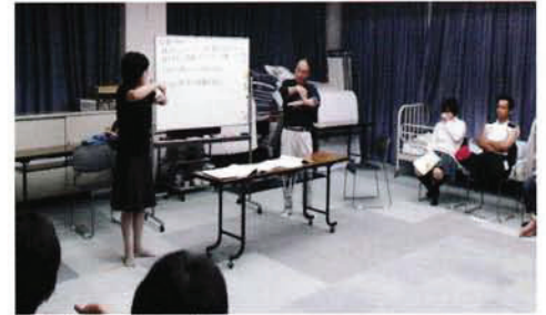
手話奉仕員養成事業