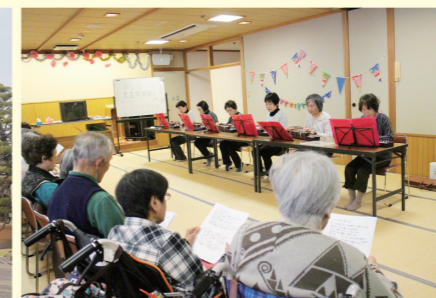
みさき琴の会交流会