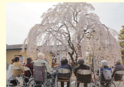
田富妙泉寺のしだれ桜の花見