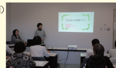
生活支援体制整備事業