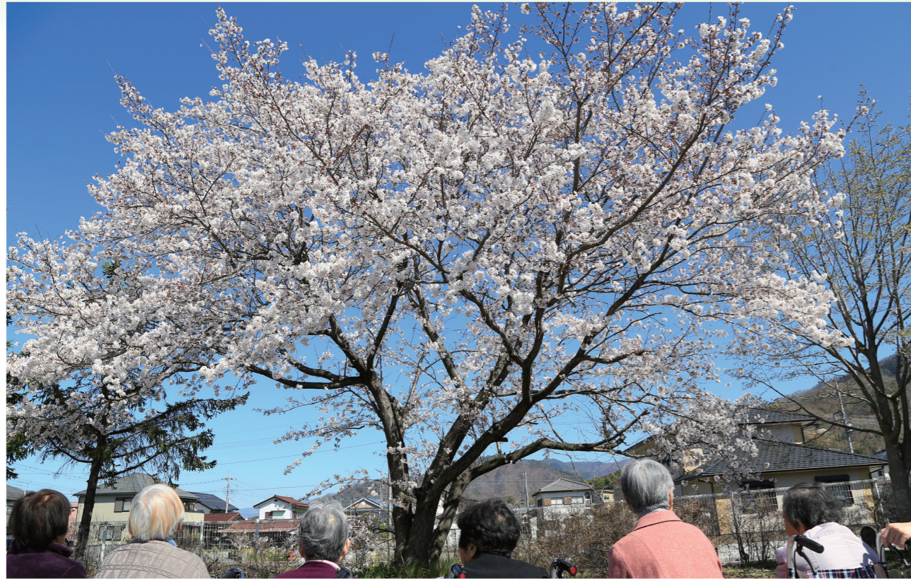
デイサービスお花見 (ケアセンター駐車場)