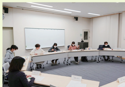
子育て・子育て支援ネットワーク連絡会

社協は「市川三郷町子育て・子育て支援ネットワーク連絡会」に加入しています。連絡会は、町内の17団体で構成され、主に子育て、子育て支援を充実するための研修会や情報交換会を行っています。また、子育て支援フェスティバルを開催し、社協もボランティアの募集や調整等を担っています。