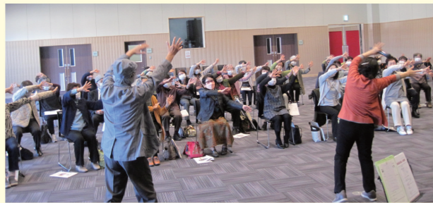
ふれあいいきいきサロン事業