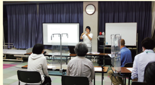
手話奉仕員及び中級手話奉仕員養成事業