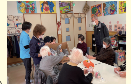
ミニデイサービス