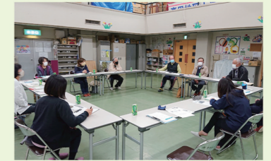
生活支援体制整備事業