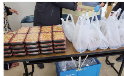
手作りの炊き込みご飯

今年度は峡南地区をモデル地区とし、峡南地域にある支援団体で共同開催しました。峡南地区では、子育て世帯に限らず、様々な困難を抱え、食料や生活用品を必要とする方を対象に食品や生活用品を配布するフードパントリーを開催しました。大塚にんじんを使用した炊き込みご飯や野菜、日用品、文房具等をお渡しし、参加者からは「たくさんの食品や日用品をもらえて、嬉しいです。とても助かります」との声をいただきました。