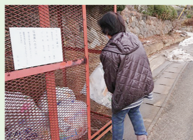
手つだい隊・活動の様子

こまりごと手つだい隊は、ゴミ出し、電球交換、買い物代行など、高齢者宅の「ちょっとしたお手伝い」をする活動です。現在、活動登録者を募集中です。手つだい隊を利用したい方、ボランティアとして活動したい方、いずれも事前の登録が必要となりますので、社協までご連絡ください。