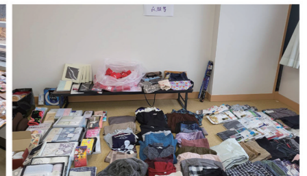
日用品や衣類コーナー