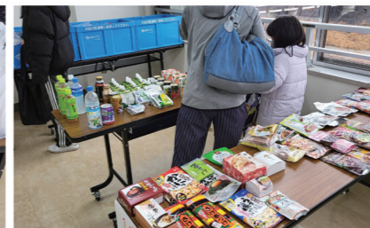
日持ちする食材コーナー