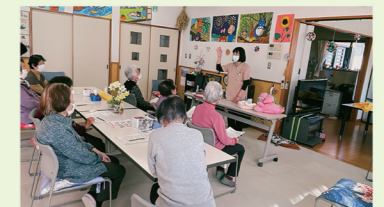
ミニデイサービス